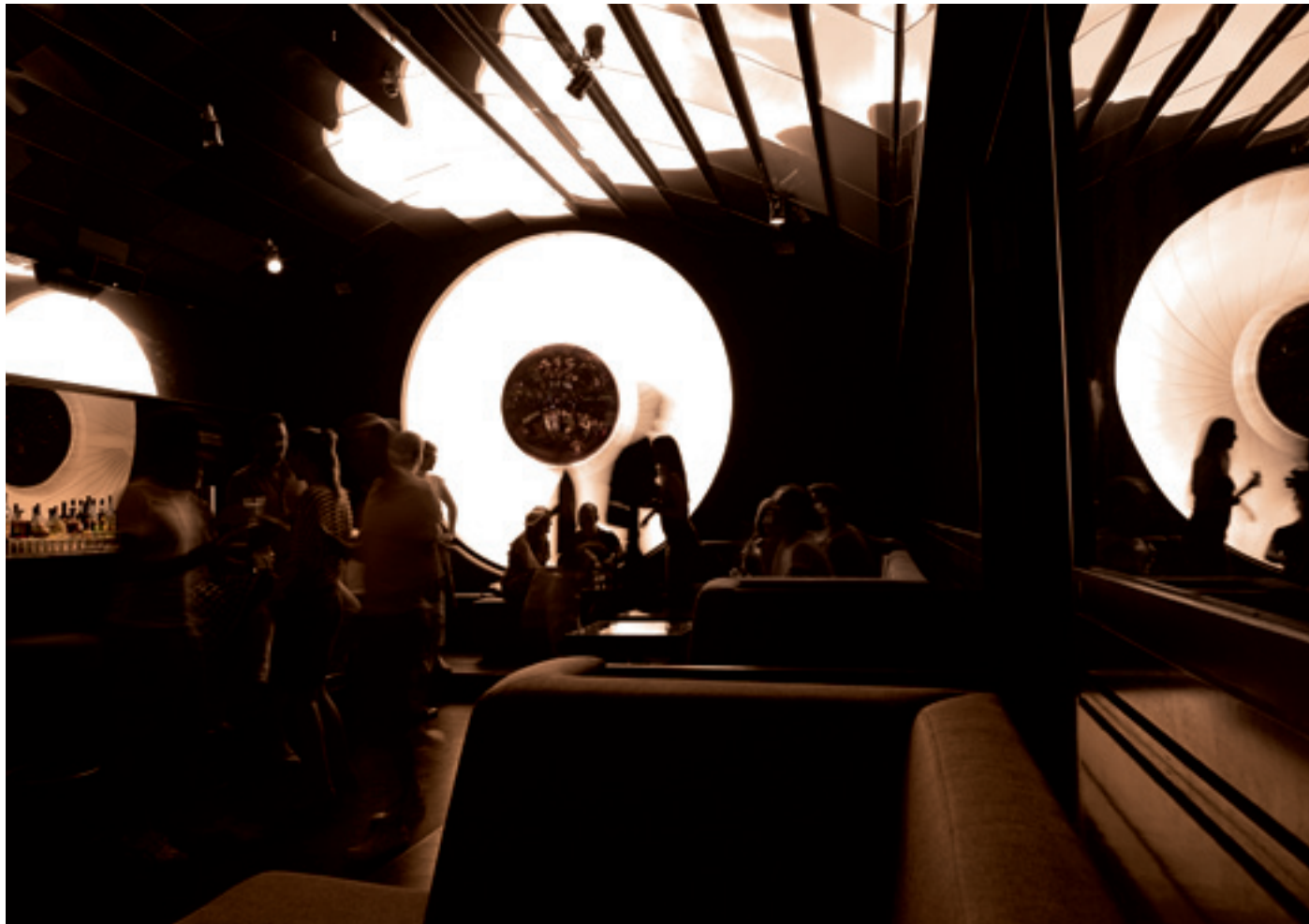
Berlin, New York, London, Tokio! Mit ihrem mondänen Interior Design im 80er-Jahre-Clubstyle ist die Bar Tausend der Inbegriff von internationalem Partychic. Die Lichtinstallation „Das Auge“ vom Berliner Lampenmacher „Schneider-Moll“ am Raumende schmückte einst die Verkaufsräume von Louis Vuitton in Paris.

Markenzeichen der Leica Camera Gruppe „Leica“ sowie Produktnamen = ® Registrierte Marke © 2010 Leica Camera AG HDMI, das HDMI Logo und „High-Definition Multimedia Interface“ sind Marken oder registrierte Marken von HDMI Licensing LLC. Änderungen in Konstruktion, Ausführung und Angebot vorbehalten Konzept und Gestaltung: argonauten G2, Frankfurt am Main Prospekt-Bestellnummer: Deutsch 91 538 / Englisch 91 539 / Französisch 91 540 / Japanisch 91 541 / Chinesisch (simplified) 91 548, (09/2010) Leica Camera AG / Oskar-Barnack-Straße 11 / 35606 SOLMS / DEUTSCHLAND Telefon +49(0)6442-208-0 / Telefax +49(0)6442-208-333 / www.leica-camera.com