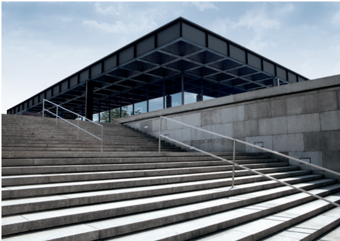
Die Neue Nationalgalerie (1965-1968) gilt als Mies van der Rohes architektonisches Meisterwerk. Sie ist das einzige Bauwerk, das der ehemalige Bauhausdirektor nach dem Krieg in Deutschland umsetzen durfte.