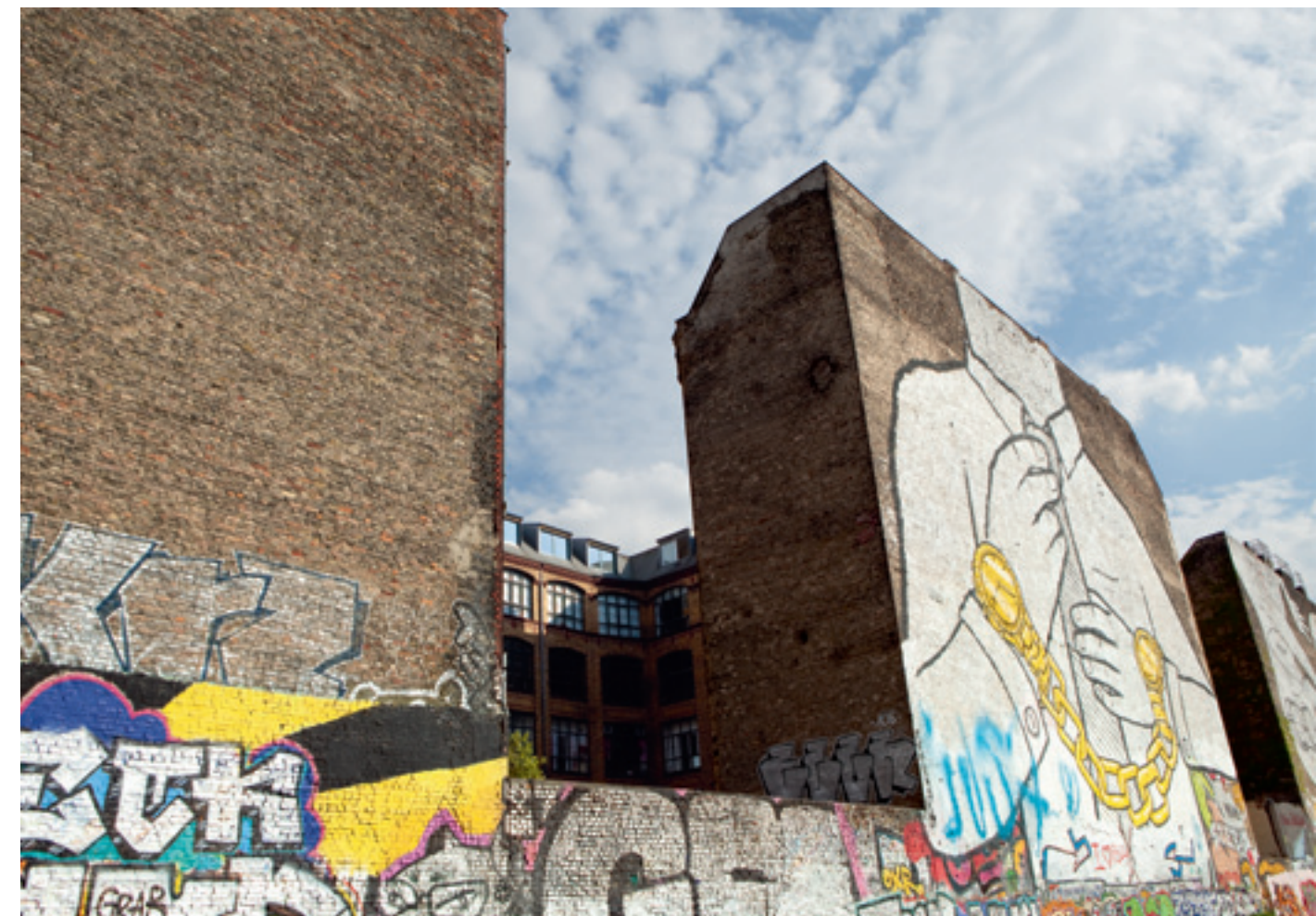
Oben: Vier international bekannte Streetart-Künstler gestalteten im Auftrag der neuen Besitzerin den Steglitzer „Bierpinsel“ im Frühjahr 2010 neu. Unten: Für Streetart-Künstler ist Berlin dank seiner vielen gestaltbaren Flächen schon lange die Stadt der unbegrenzten Möglichkeiten. Viele Künstler starteten ihre internationale Karriere in der deutschen Metropole.