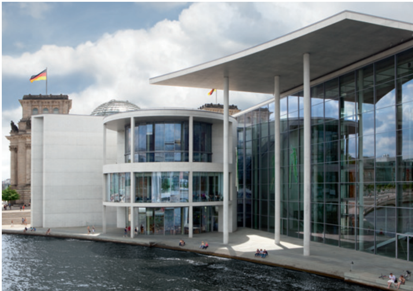
Das gibt es nur in Berlin: Liegestühle und Strandatmosphäre mitten im Regierungsviertel.

Berlin ist in vieler Hinsicht einzigartig – so entstand mit dem Fall der Mauer das größte „Experimentierfeld“ für moderne Architektur, das es in einer europäischen Hauptstadt in jüngster Zeit gegeben hat. Allen voran der neu gestaltete Potsdamer Platz und das neue Regierungsviertel, das sich nördlich des Reichstags erstreckt. Der Masterplan der Berliner Architekten Schultes und Frank wird gemeinhin als Geniestreich angesehen. Aber selbst das hat in Berlin Tradition: Die unweit gelegene Neue Nationalgalerie, 1965 bis 1968 nach Plänen des ehemaligen Bauhausdirektors Mies van der Rohe erbaut, gilt bis heute als Ikone der Klassischen Moderne.