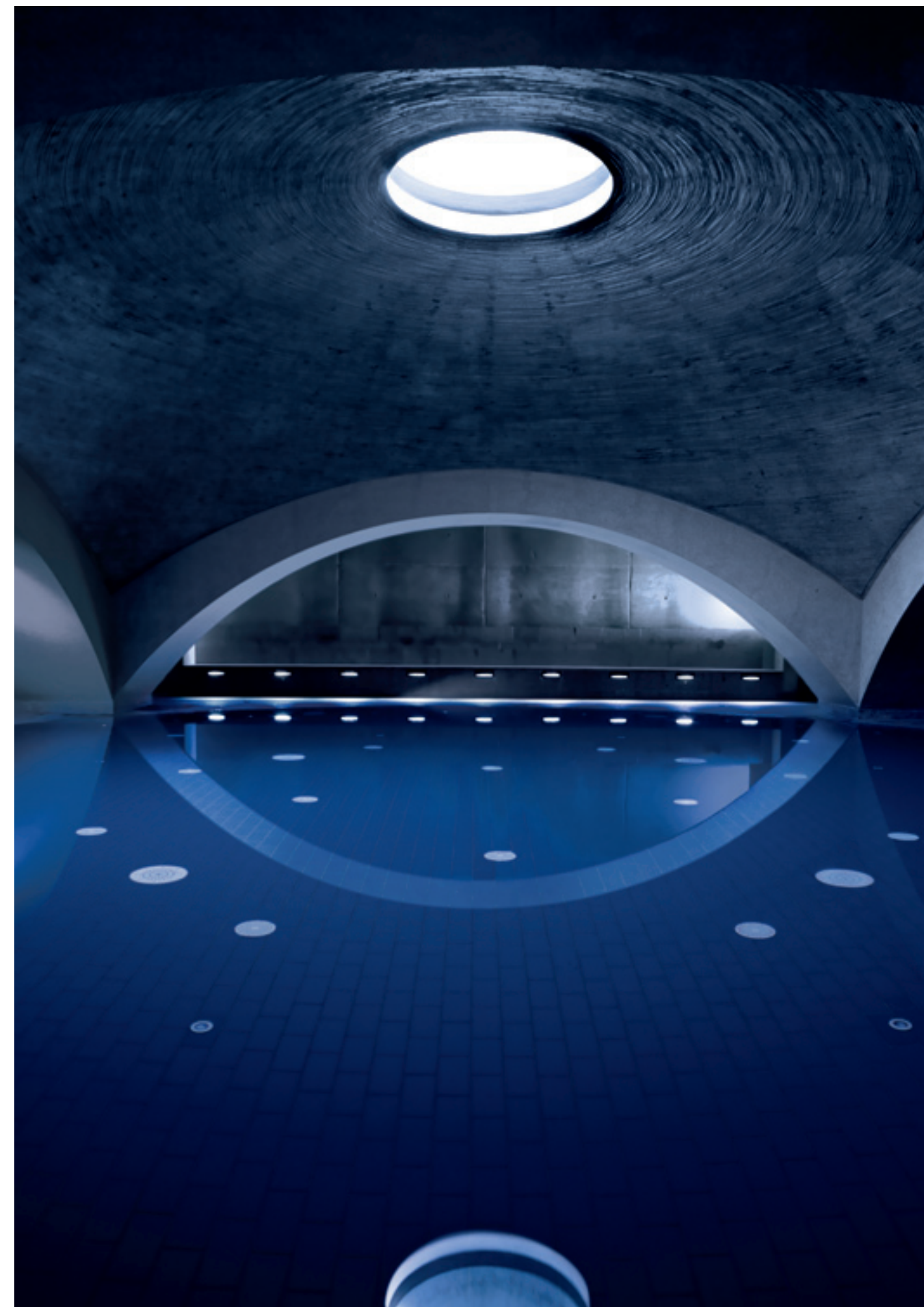
Das Liquidrom im Herzen Berlins bietet urbane Badekultur im wahrsten Sinne des Wortes: Farben und Lichtspiele vereinen sich unter Wasser mit Musik. Passend dazu sind hier die Wasser-Klangbilder des Künstlers A. Lauterwasser zu bewundern.